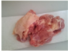
若鶏皮つきもも肉