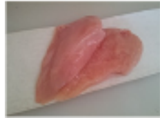
若鶏皮なしむね肉